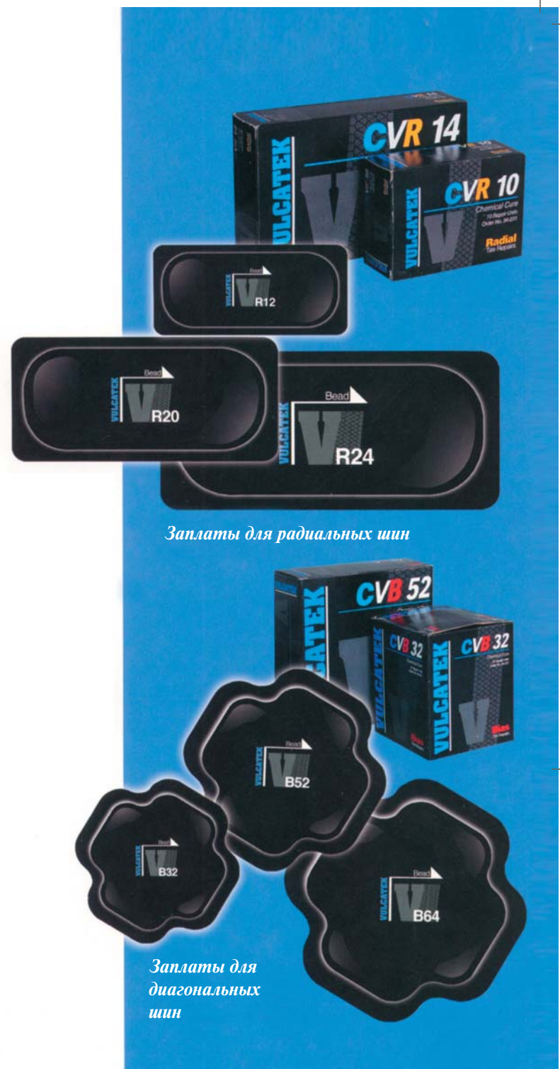
Заплаты для радиальных шин