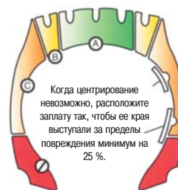
Ремонт радиальных шин