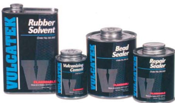
Химические реагенты Vulcatek